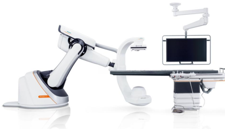
据置型デジタル式循環器用X線透視診断装置 ARTIS フィーノ 認証番号：304AABZX0005600

～高画質・低被ばくと直感的な操作性により、ニーズの高まる低侵襲な血管内治療の高度化に貢献～