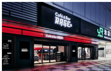
《Café & Bar RAGE ST》