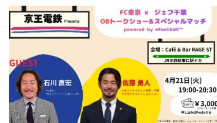
《イベントキービジュアル》