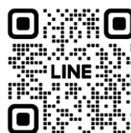
《「京王スポーツ」公式LINE》