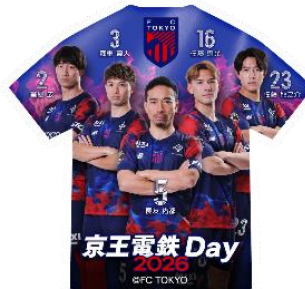
《スタンプ（イメージ）》