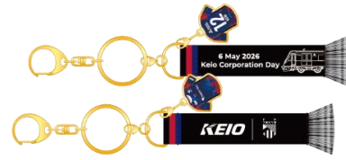
《アクリルスタンド（イメージ）》 《マフラーキーホルダー（イメージ）》