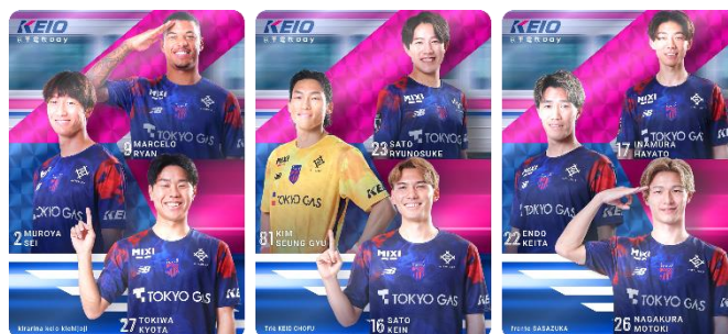
《オリジナルカードデザインイメージ》

korekatsu.com/signin?utm_source=fctokyo_web&utm_medium=referral&utm_campaign=launch