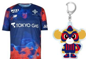
《抽選会グッズイメージ》