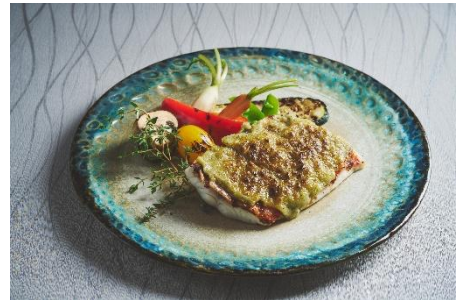
沖縄県産鮮魚グリル イーチョーバーとシークワサー風味のバター添え イメージ