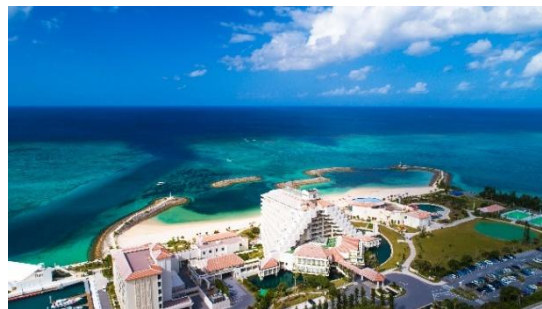
シェラトン沖縄サンマリーナリゾート 空撮

シェラトン沖縄サンマリーナリゾートは、環境省より最高ランクの「AA」に認定された美しい白砂ビーチに面した、全客室バルコニー付のリゾートホテルです。沖縄本島でも珍しいマリーナ付属の様々なマリナクティビティが楽しめるホテルとして、大人から子供まで一日中楽しめるご滞在を提供しております。