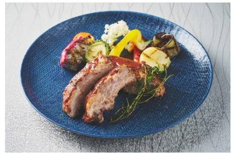
ベイベーバックリブのグリル BBQソース イメージ

※記載の内容は、食材の仕入状況等により予告なく変更または中止となる場合がございます。