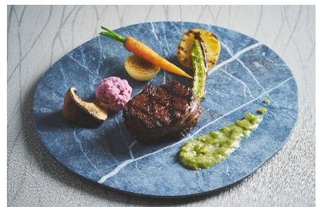
国産牛フィレ肉の塩こうじマリネのグリル イメージ