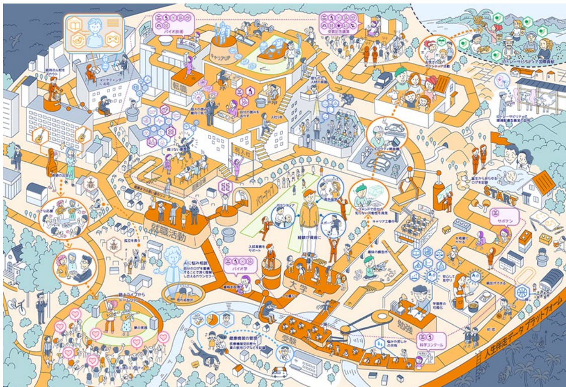
【参考：当社が目指す「社会の信用インフラ事業者」の世界観】

当社は、『アップデミー®』を通じて、個人の学びや体験実績を「改ざん不可能な信用」という価値に変え、社会に新たな機会を創出することを目指しています。