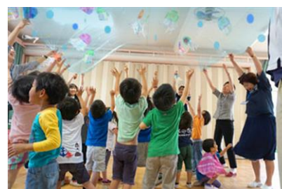
「クラゲとザブーン」

タイトル：クラゲとザブーン 開催期間：2015年10月10日(土)～11月29日(日) 期間中の土日 開催時間：時間未定 開催場所：すみだステージ 参加対象：親子(3歳以上のお子さまとその保護者) 参加方法：当日受付 参加料金：無料 開催内容：クラゲのモビールをつけた大きな布をみんなで一緒に持ち上げて、クラゲたちが漂う大きな波や小さな波を作るプログラムです。思いっきり体を動かして遊びましょう。