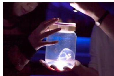
「ふわふわクラゲガール」

タイトル：「ふわふわクラゲガール」 開催期間：2015年9月11日(金)～12月25日(金)の毎週金曜日 開催時間：各日19時30分～19時50分 参加対象：18歳以上の女性 参加定員：各回10組20名 参加方法：すみだ水族館公式ホームページで事前募集 参加料金：無料 開催内容：水中をふわふわと漂う謎多き生物・クラゲは、子どもだけではなく、大人にとっても不思議な生き物です。 「ふわふわクラゲガール」は、夜の水族館でクラゲをじっくりと観察するプログラムです。毎週金曜日の夜に女性限定で行いますので、一週間の仕事が終わった後、ふわふわ漂うクラゲに癒されてみてはいかがでしょうか。