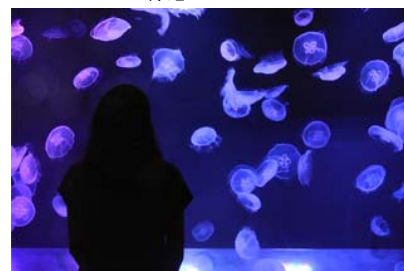
「秋を楽しむ。ミズクラゲ水槽」

タイトル：秋を楽しむ。ミズクラゲ水槽 展示期間：2015年9月24日(木)～9月30日(水) 展示時間：終日開催 展示場所：クラゲゾーン ミズクラゲ水槽 展示内容：9月27日(日)の「中秋の名月」に合わせ、ミズクラゲの水槽を、海の中に届く月の光をイメージしたブルーやパープルにライティングします。幻想的な光の中で泳ぐミズクラゲを見ながら、心地よい秋の訪れを感じてみてください。