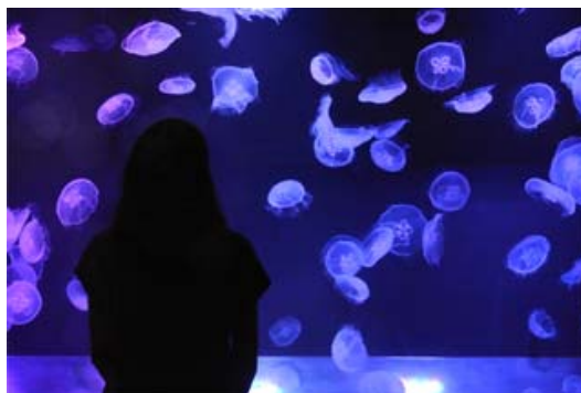
「秋を楽しむ。ミズクラゲ水槽」

さらに、館内のペンギンカフェではクラゲをイメージした限定メニュー「ふわふわクラゲソーダ」を販売します。また、9月27日(日)の「中秋の名月」に合わせ、「クラゲ」ゾーンではミズクラゲの水槽を海の中に届く月の光をイメージしたブルーやパープルにライティングします。