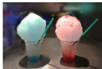
(右)ふわふわクラゲソーダ 昼

開催内容：ふわふわしたクラゲをイメージしたわたあめが乗った、ピーチ味のゼリー入りのソーダです。『蜷川実花×すみだ水族館 クラゲ万華鏡トンネル』の昼バージョンと夜バージョンのそれぞれをイメージしたカラーでお楽しみいただけます。また、大人向けとしてアルコール入りも販売します。