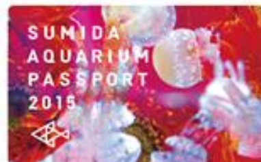
オリジナル年間パスポートデザイン

販売期間：2015年9月9日（水）～12月27日（日） ※販売枚数に達しますと、期間中でも終了させていただきます。 販売時間：9時00分～20時00分 販売場所：年間パスポート窓口 デザイン：1種類 販売内容：『すみだ水族館』の年間パスポートは、通常の2回分の入場料で、1年間に何回でもご入場いただけるお得なパスポートです。期間限定で、特別デザインの年間パスポートを販売します。