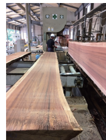
(無垢大断面製材)