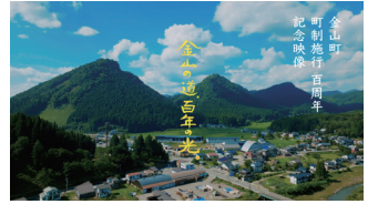
(「金山の道、百年の光。」)