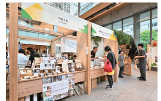
2025年開催時の様子 来場実績：延べ 13,415名（32日間）