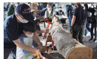
(世田谷区本庁舎 ケヤキ製材ワークショップ)