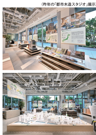
(昨年の「都市木造スタジオ」展示)

都市部に建つ中高層の木造建築「都市木造」の最新プロジェクトを発表する「都市木造スタジオ」。この数年急増し、規模も拡大している都市木造プロジェクトの2000年以降の変遷とこれからを紹介し、再開発が進行中の東京駅周辺エリアで、豊かな都市空間と木の循環を両立する建築やまちづくりを考えます。今年は「木で空間を魅力的に見せるための技術やデザイン」をテーマとし、首都圏を中心とした14プロジェクト(予定)を、日本を代表する設計会社、建設会社が画像や映像、模型等でプレゼンテーションします。