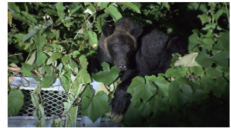
(「劇場版 クマと民主主義」)