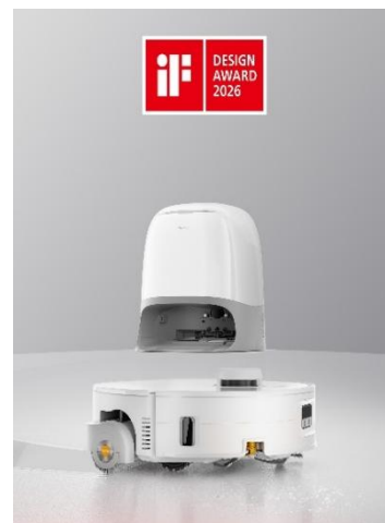
「Qrevo Curv 2 Flow」

Roborock初のローラーモップ搭載ロボット掃除機「Qrevo Curv 2 Flow」も受賞しました。本モデルは、最大220回転/分 ※3 の高速回転と15Nの圧力で汚れを効率的に除去するワイドローラーモップを搭載することで、モップの性能を大幅に向上させました。また、掃除中にモップを自動洗浄できる「SpiralFlow™」や、壁際までモップを伸ばして掃除を行う「Edge-Adaptive capabilities（エッジアダプティブ機能）」を搭載することで、あらゆる掃除シーンで高いパワーと精度を実現します。