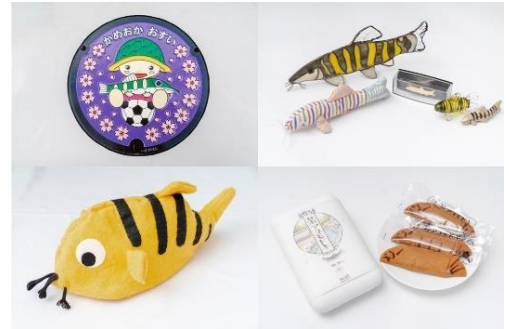
アユモドキモチーフのさまざまなグッズを展示

野生のアユモドキが生息している京都府亀岡市では、アユモドキを守るさまざまな活動に取り組んでいます。アユモドキがなぜ数を減らしているのか、亀岡市ではどのような保全活動が行われているのかをパネルで紹介するとともに、アユモドキをモチーフにしたさまざまなアイテムを展示します。スタンドグラスや箸置き、マンホールなど多様なアイテムをご覧ください。