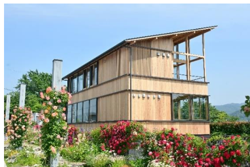
Circular Kameoka Lab