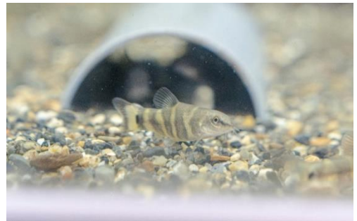
アユモドキの幼魚

生態：河川の中流～下流の遮蔽（しゃへい）物の多い砂礫底・岩場も見られる砂泥底の環境を好む。