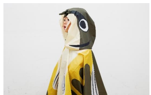
幼魚のポンチョ着用イメージ

さらに、体のしま模様が特徴的な幼魚のアユモドキとアユのような体色の成魚のアユモドキをモチーフにしたポンチョを設置します。ポンチョを身に着けて、ご家族でアユモドキになりきって記念撮影をお楽しみください。