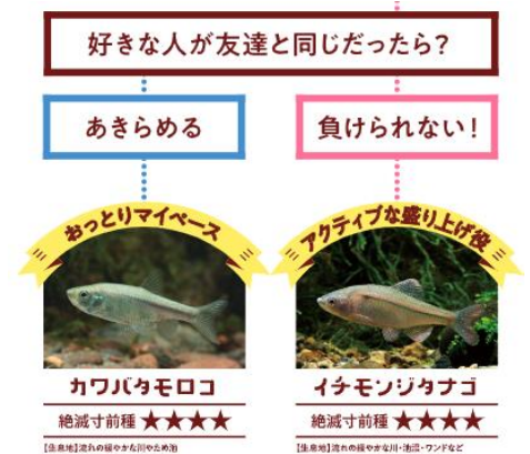
京都府レッドリストのいきもの診断 (一部抜粋)

京都水族館2階の「山紫水明」エリアでは、京都府で絶滅の危機にひんするさまざまな淡水魚を飼育し、館内繁殖にも取り組んでいます。多様な希少種を知ってほしいという思いから、診断形式でいきものを知る「京都府レッドリストのいきもの診断」を展示します。あなたの性格と似ている特徴のいきものはどれなのか、ぜひトライしてみましょ。結果がわかったら、本物のいきもの観察もお楽しみください。