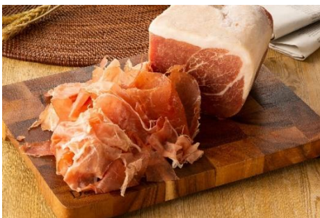
切り出しハモンセラーノ (イメージ) 869円