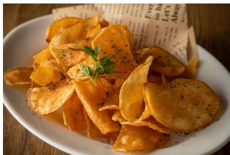
揚げたてポテトチップス 649円