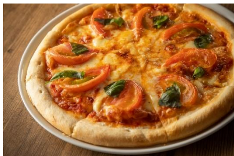
トマトとフレッシュバジルのマルゲリータ 1,485円