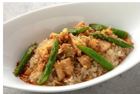
ゴロゴロチキンのガーリックライス 1,155円