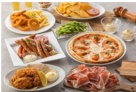
各種飲み放題付きコース 3,300円～