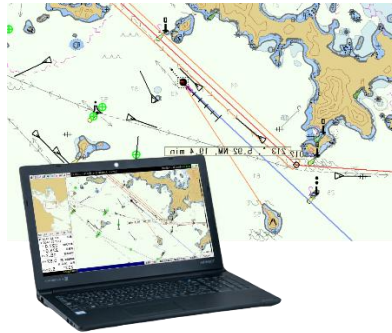
戸高製作所：運航サポーター