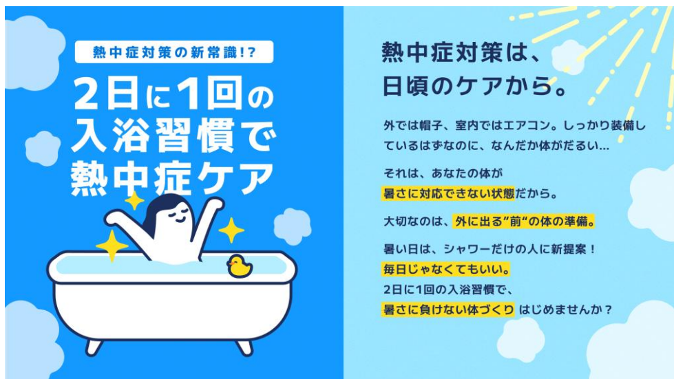
「熱ケア」サイト画面イメージ

アース製薬株式会社（本社：東京都千代田区、社長：川端克宜、以下「アース製薬」）は、忙しい現代人の「お風呂の質（Quality of Furo）」を向上させるためのプロジェクト「QOF 向上プロジェクト」第二弾として、「入浴と熱中症」に関する研究成果をより多くの生活者にお伝えし、社会全体の熱中症リスク軽減に貢献することを目的に、新たに「熱ケア」サイトをオープンしました。