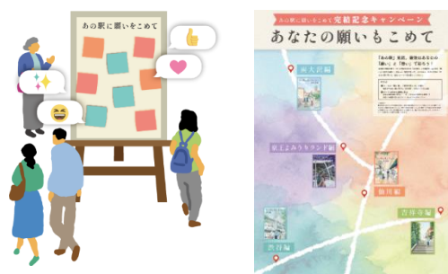
《寄せ書き掲示板 イメージ》