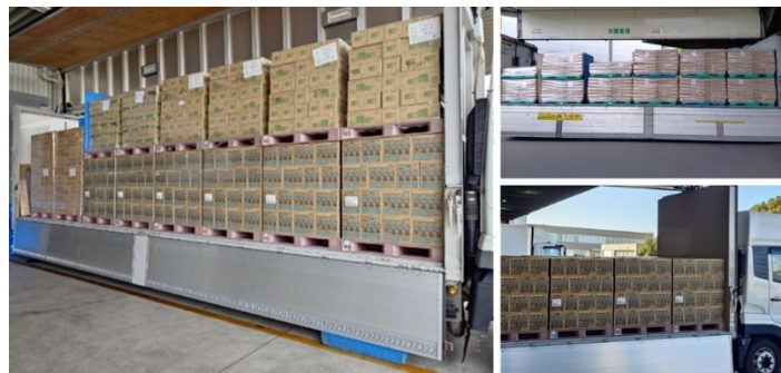
(左)静岡～千葉間の共同輸送の様子、(右)静岡～関西間の「ラウンド」輸送の様子

昨今、トラックドライバーの人手不足や物流における環境負荷低減への対応など、物流を取り巻く社会課題が顕在化しています。ネスレ日本と伊藤園は、こうした課題の解決に向けて、両社の物流特性を活かした共同輸送の検討を進めてきました。