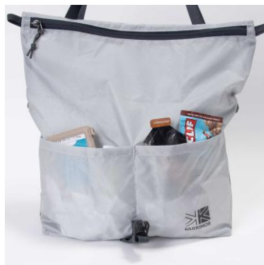
フロントオープンポケット