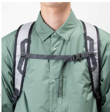
チェストストラップ