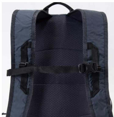
チェストストラップ