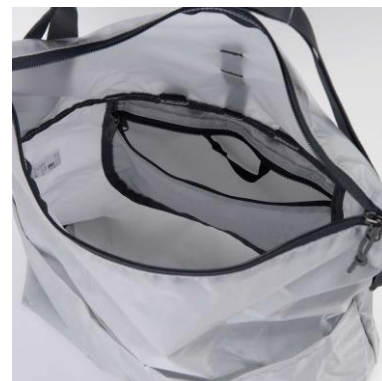
本体内部ポケット