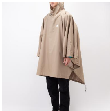
リュックを背負ったままでも着用可能