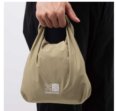
濡れたポンチョも収納できるロールトップ式のスタッフバッグ付き