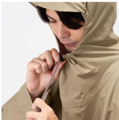
ワンアクションで調整可能なフード口アジャスター