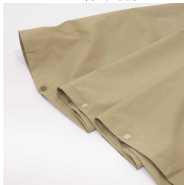
止め間違いを抑止する両脇スナップボタン