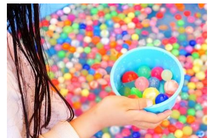
夏色縁日 イメージ