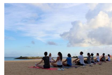
モーニングヨガ体験 イメージ

※前日17:00までの要事前予約（予約サイトは整い次第ホテル公式HPへ公開させていただきます）