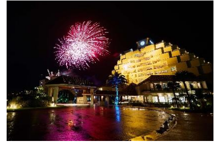
夏の花火祭り イメージ