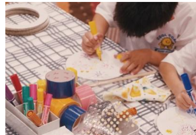
パーランクークラフト イメージ

パーランクーは、沖縄の伝統芸能であるエイサーに使用される太鼓。段ボールを組み合わせ色付けや装飾を施し、世界に一つだけのパーランクーを作りましょう。三線の生演奏と合わせ実際に演奏もできる、沖縄ならではの特別なお時間です。さらに、海洋プラスチックを活用した万華鏡作り体験も新たに開催。ホテルのビーチクリーニングで回収したプラスチックも素材として一部活用し、楽しみながら学び考える、この地ならではの時間をご用意しております。