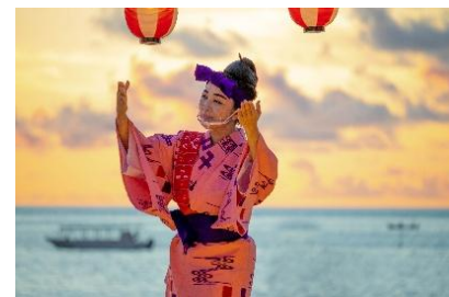
夏の盆踊り祭り イメージ