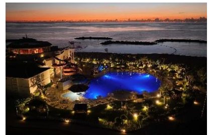
ナイトプール イメージ