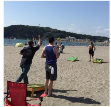
パーティースポーツ 「コーンホール」