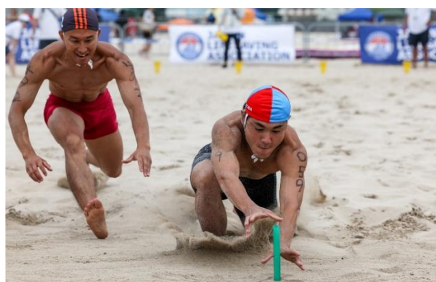
「昨年のライフセービング選手権大会の様子」