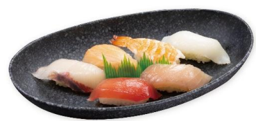
ビックらポン！厳選6貫セット 790円 (熟成まぐろ・ビントロ・サーモン・はまち・いか・えび) ※お持ち帰り不可