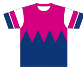
《勝負服風デザインTシャツイメージ》