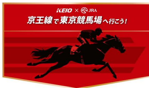
《ヘッドマークイメージ》