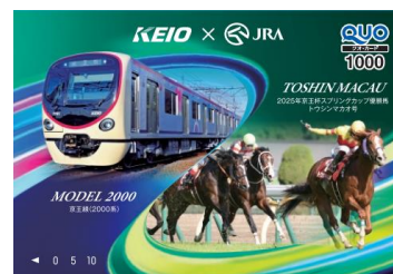
《オリジナルQUOカード イメージ》