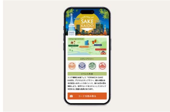
デジタルスタンプラリー画面(イメージ)