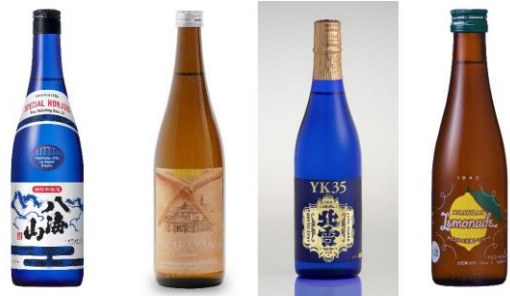
提供予定の日本酒(一部)

さらに、出汁の旨みが染み渡る郷土料理「のっぺ汁」をはじめ、甘辛い「タレカツと栃尾の油揚げのネギ味噌焼きセット」、スパイシーで酒が進む「鶏のカレー揚げ」など、新潟の美酒を一層引き立てるご当地グルメも会場に登場。