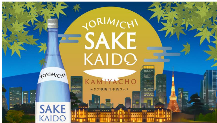
「YORIMICHI SAKE KAIDO」ロゴ

森トラスト株式会社は、2026年5月より都内で運営する神谷町、赤坂、御殿山、丸の内の4エリア連動型の日本酒イベント「YORIMICHI SAKE KAIDO」を順次開催いたします。各エリアで地域テーマをリレー形式で展開し、仕事帰りの“寄り道”で気軽に日本酒の魅力や各地の食文化に触れられる体験を提供します。主にオフィスワーカーや地域住民の皆様に向けた新たな交流機会を創出するとともに、エリア内のホテルに宿泊するゲストなどにも、都心にいながら日本の地方の魅力を感じていただける場を目指します。