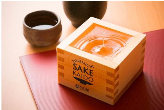
イベントオリジナル升(イメージ)

また、神谷町を皮切りに、今後開催を予定している他エリア(赤坂、御殿山、丸の内)を繋ぐ「エリア周遊キャンペーン」を実施。各会場に足を運んで LINE デジタルスタンプを集めると、抽選で豪華賞品が当たる特別なプレゼント企画をご用意しています。