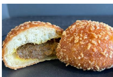
「BAKERY GOLDEN RATIO」 カレーパン