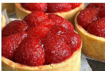
「twins bake」 焼きいちごのタルト