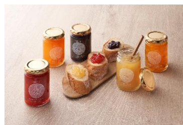
「万平ホテル」 ジャム各種