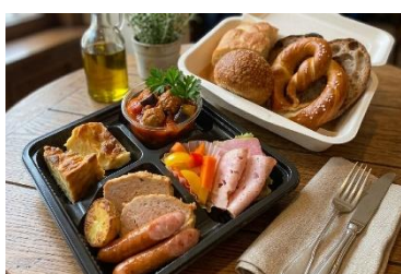
「パンとごはんやさとう」 パン酌セット