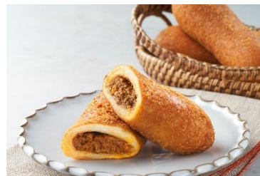
万平ホテル カレーパン

昨年初出店し大盛況だった軽井沢のクラシックホテル「万平ホテル」の出店が今年も決定！おすすめ商品は、ホテル伝統のカレーをアレンジした「万平ホテル カレーパン」です。