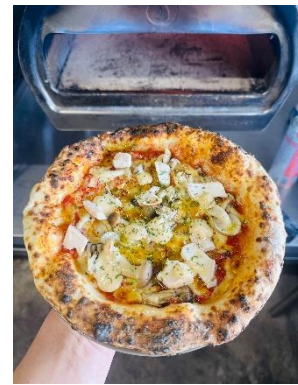
ピザ完成イメージ

参加方法：イベント当日、運営本部にて森トラスト公式 LINE のお友達画面を提示、先着順に受付