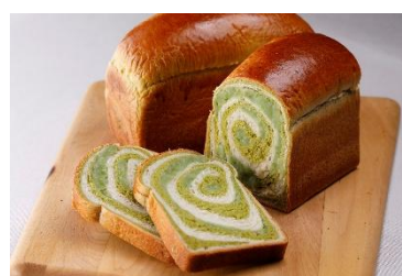
「ウェスティンホテル仙台」 ずんだブレッド