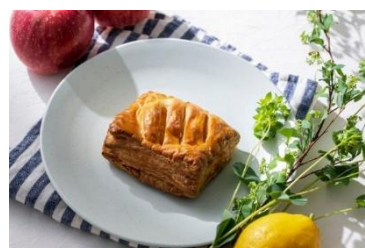
信州りんごのアップルパイ