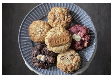
「Pie at...」 NY クッキー