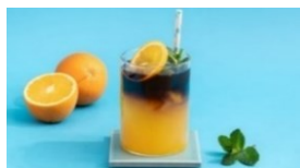
オレンジコーヒー

新 CM「ネスカフェ エスプレッソベース「それは、あなたを自由にするエスプレッソ。」Product 篇」では、3種類のアレンジ「オレンジコーヒー」、「抹茶コーヒーラテ」、「グラノーラヨーグルトラテ」を紹介しています。