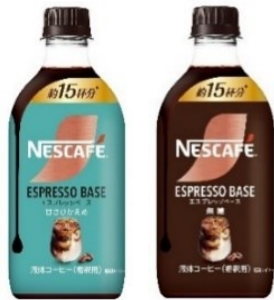
(左から)「ネスカフェ エスプレッソベース 甘さひかえめ」、「同 無糖」