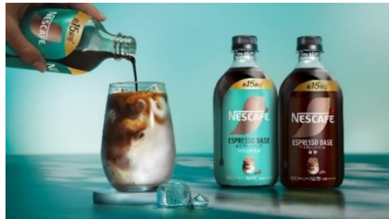
「ネスカフェ エスプレッソベース」イメージ

「ネスカフェ エスプレッソベース」ブランド情報: https://nescafe.nestle.jp/espresso-base