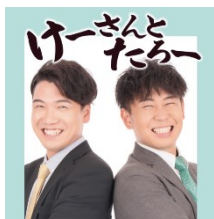
けーさんとたろー

TikTok: https://www.tiktok.com/@yuraneko