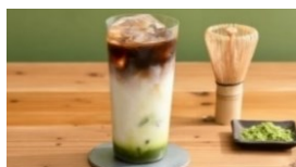
抹茶コーヒーラテ