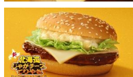
せいやさん「じゃがいも と チーズ〜♪」