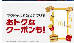
NA「おトクなクーポンも!」