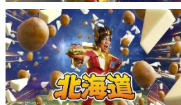
せいやさん「北海道にせいやー♪」