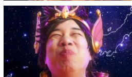
せいやさん「はまけけ♪」