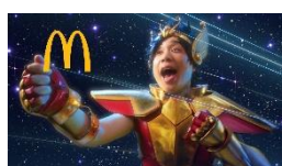
せいやさん「せせせせせいやー♪」