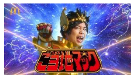
せいやさん「ご当地マックにせいやー!!」