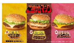
NA「ご当地マック、今だけ」