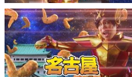
せいやさん「名古屋にせいやー♪」