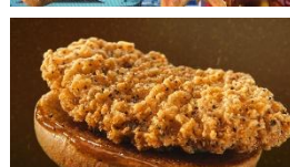
せいやさん「手羽先風さ ジューシー♪」