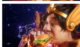
せいやさん「今だけ♪」