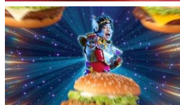
せいやさん「せいやー!」