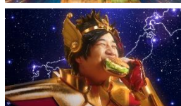
せいやさん「ご当地にせいやー♪」