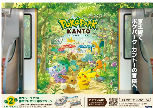
≪キャンペーン告知イメージ≫

今後も、『ポケパーク カントー』との連携強化により、沿線地域の活性化および移動需要の創出を図ってまいります。