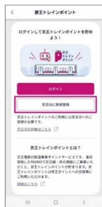
【京王IDに 新規登録】を行う