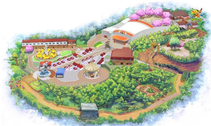
◀『ポケパーク カントー』全体図▶

約2.6ヘクタールの広さを持つ、ポケモンの魅力に触れることができる屋外常設型施設。600匹を超えるポケモンが暮らす森と街をめぐる冒険がすべてのトレーナーに忘れられない発見をもたらす、ポケモンいっぱいのトレーナーズエリアです。段差のある道や草むら、トンネルや山道など、多彩な地形が広がる豊かな森「ポケモンフォレスト」と、グッズ満載のワゴンが立ち並ぶトレーナーズマーケット、ポケモンセンター、フレンドリィショップ、ジム、ポケモンたちが集うグリーティング・パレード、2つのアトラクションが楽しめる「カヤツリタウン」の大きく2つのエリアに分かれています。