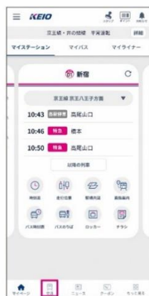
交通タブを タップ