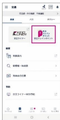
京王トレイン ポイントをタップ