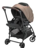
THE S Go