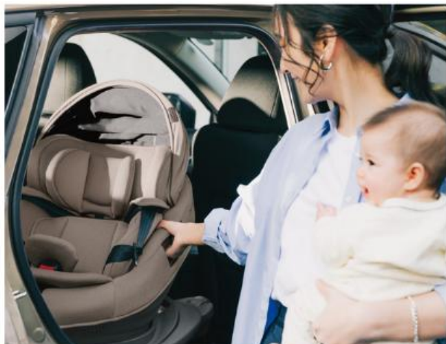
片方をにぎると、クルッと回転