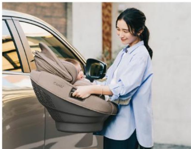
両方をにぎると、パッと着脱

従来品では、それぞれ別の専用レバーを設けていた「回転」と「着脱(セパレート)」操作を、側面のグリップのみへ集約しました。回転するときは「片手」、着脱するときは「両手」と、握り方を変えるだけで2つの動作が使い分けられます。