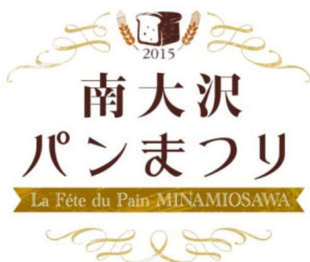
「南大沢パンまつり」ロゴ

リニューアルを記念し、10月30日(金)から一部先行リニューアルセールを開催します。11月13日(金)からはリニューアルグランドオープンセールを開催します。また、地元の「元気な街」南大沢協力の会と連携し、有名パン屋約50店舗が集結する「南大沢パンまつり」を、一部先行リニューアルオープンに合わせて11月1日(日)から11月3日(火・祝)まで開催します。また、その他各種イベントを新設された「フェスティバルステージ」において開催します。