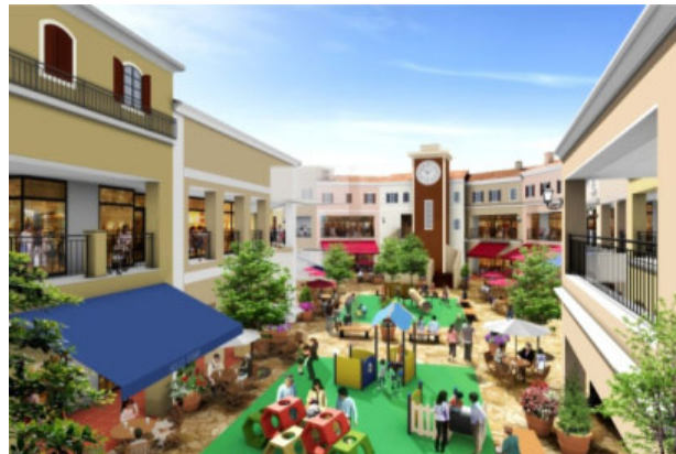
「ギャザリングコート」イメージ (A 街区)

また、開業以来、施設の特徴である南仏プロヴァンスの街並みをモチーフにした外壁面の改装など施設設備もリニューアルし、新しく生まれ変わった施設となります。