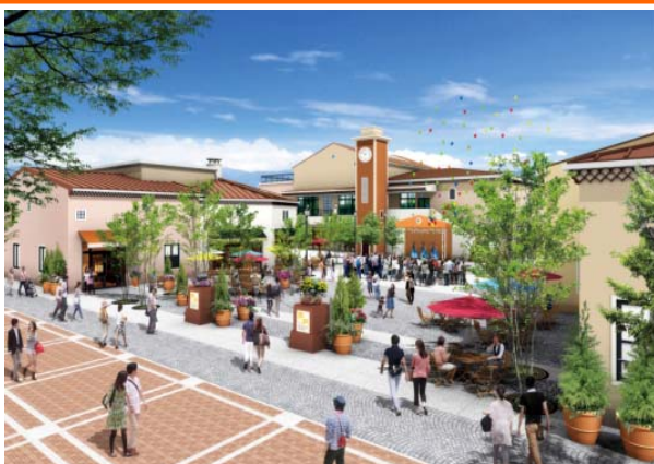
「フェスティバルステージ」イメージ（B街区）