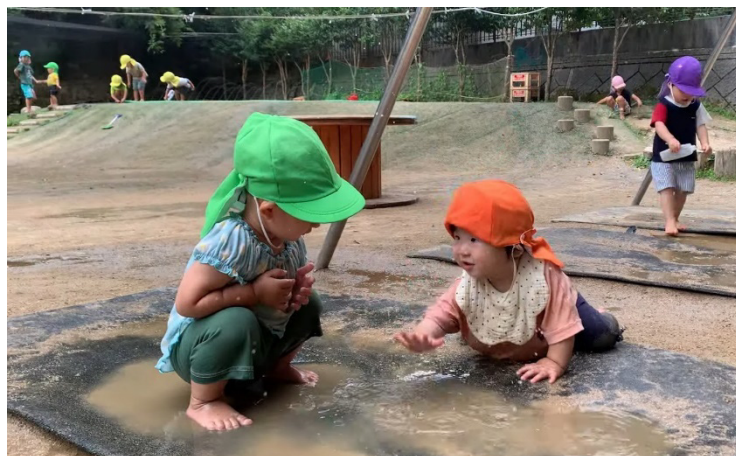
写真：最優秀園 論文表紙（左）・城崎こども園の子どもたちの様子（右）

「最優秀園 実践発表会」の研究テーマは、「はじめての発見が生まれるとき～0・1歳児が五感で味わう身近な環境との出会い～」です。公開保育や研究発表にとどまらず、講師、園職員を含むさまざまな立場の参加者が「対話」を通して、乳幼児期の子どもの「科学する心」の芽生えや、それを支える保育者の関わりについて、じっくりと語り合える場を提供いたします。