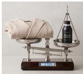
イメージ画像です。

今年の5月は既に各地で真夏日が記録されるなど、季節の進みが例年よりも早まっています。気象庁が発表した3か月予報（5月～7月）でも全国的に高温傾向が続くとされており、早い時期から「本格的な暑さ対策」が求められています。ビジネスウエアにおいても多様化が進む一方で、大切な商談や外回りでは、ジャケットが欠かせないビジネスパーソンも少なくありません。そのようなお客様からは「外では暑くて着てられない」「カバンに入れるとシワが気になり、その後の交通機関やオフィスで着用しづらい」といった暑さと持ち運びに関する声が寄せられています。そこで今回は、圧倒的な軽さと防シワ性を備えたジャケットを企画しました。気象庁3か月予報： https://www.data.jma.go.jp/cpd/longfcst/kaisetsu/?term=P3M