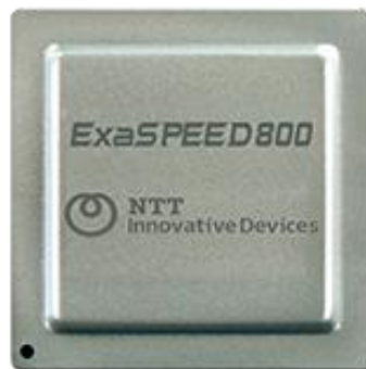
図 2. 本実験で使用した 800G コヒーレント DSP チップ (NTT イノベティブデバイス社製[5])

本研究では、世界で初めて光ネットワーク全長を可視化する機能を、光トランシーバ内部の通信用 DSP チップ[5](コヒーレント DSP、※4)上に搭載し、動作実証に成功しました(図 1)。新たに開発した独自技術により可視化に必要な計算処理量を従来比 100 分の 1 に削減することで、消費電力・実装面積の制限が厳しい通信用 DSP および、小型光トランシーバへの搭載が可能となりました。その結果、光ネットワークの異常箇所を特定できる世界初の光トランシーバを実現しました。本技術による測定結果は、専用測定器(OTDR)による測定結果と良好に一致しており、異常箇所の特定に十分な精度をもつことが確認されました。