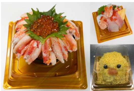
見て楽しい・食べて美味しい「魅せ丼」各種

鮮魚コーナーでは、北海道で水揚げされた定番の寿司・海鮮丼だけでなく、見て楽しい・食べて美味しい「魅せ丼」などドンキ独自のユニークな海鮮商品を提供します。シニア世帯も食べやすいサイズのミニ丼ぶりをはじめ韓国風のオリジナル創作丼ぶりなども種類豊富に用意しています。