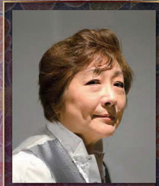
元宝塚歌劇団男役トップスター・女優 橋名由梨