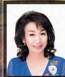
元宝塚歌劇団娘役トップスター・筑前庭巻妻 上原まり