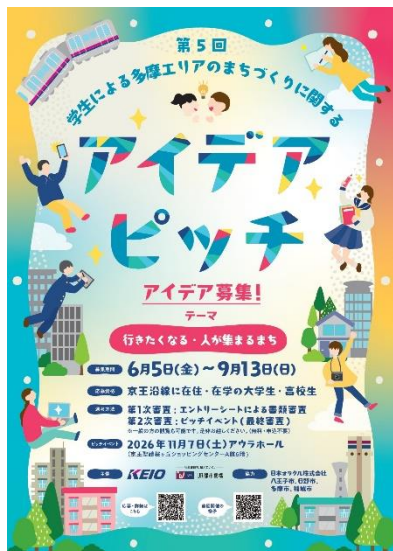
〈ポスタービジュアル〉

2022年度から高校では探究学習が必修化し、大学においても課題解決型学習の機会が増加しています。本企画は、このような背景を踏まえ京王電鉄が行ってきた授業支援の経験を活かしたテーマ設定としています。