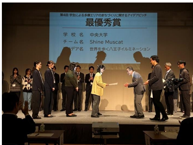
〈昨年度の表彰式の様子〉