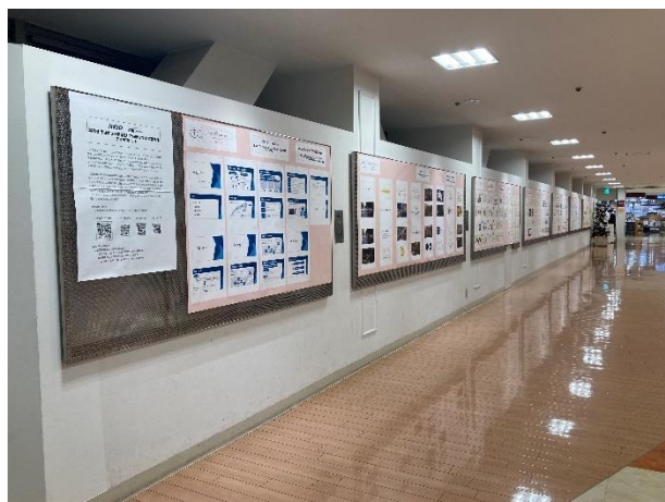
〈昨年度のせいせきＳＣでの作品展示の様子〉