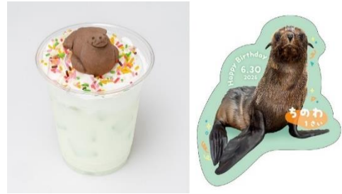
ちのわのバースデーメロンオレ

ドリンクを1点ご購入いただくと、特製ちのわステッカーが付いてきます。この機会にぜひ、ドリンクメニューをお楽しみください。