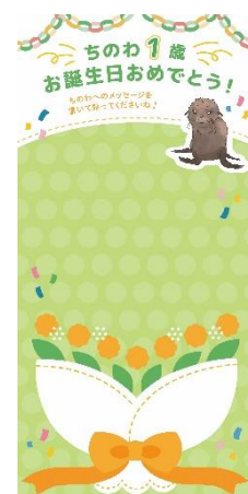
お誕生日ボード (イメージ)