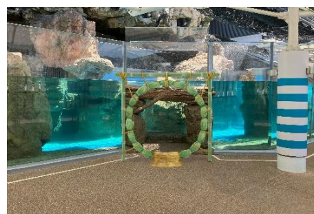
「オットセイ」エリアに設置する茅の輪 (イメージ)

今回、期間限定で「オットセイ」エリアに茅の輪を設置します。茅の輪は、当館の氏神社である六孫王神社の宮司さまにご祈祷いただいたものです。6月からは「ちのわ」が「オットセイ」エリアに登場予定で、茅の輪の近くにやってきた「ちのわ」をお客さまにご覧いただけます。期間中に茅の輪をくぐり、1年の健康と「ちのわ」の順調な成長を応援しましょう。