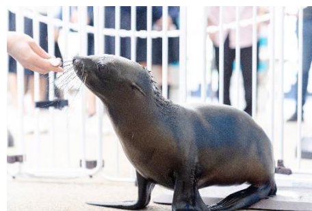
「ちのわ」の1歳をお祝いしよう

※ うちわは数量限定で、先着順でお配りします。数に限りがありますので、団体のお客さまには配布いたしません。