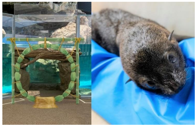
期間中、茅の輪くぐりを体験いただけます

ミナミアメリカオットセイの「ちのわ」は、2025年6月30日に京都水族館で誕生しました ※1 。これまでバックヤードで過ごしてきた「ちのわ」ですが、2026年5月22日(金)に「オットセイ」エリアへデビューし、ほかのオットセイと一緒にプールで泳ぐ姿や陸場で休む姿などをご覧いただけます。