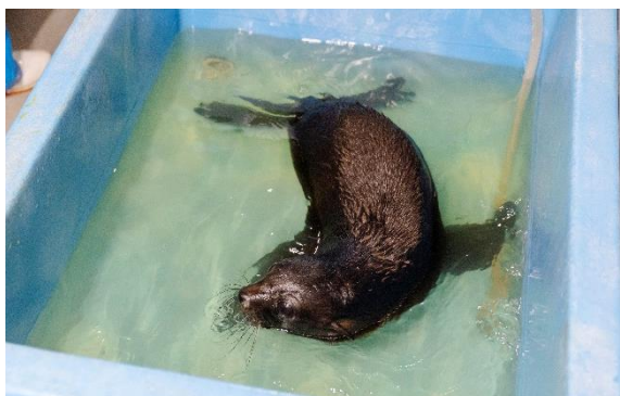
泳ぎの練習中。 水深の浅いプールで水に慣れる練習からはじめました。