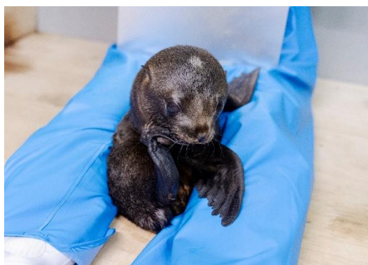
生後35日目のようす。 飼育スタッフの足の間に入るのがお気に入り。