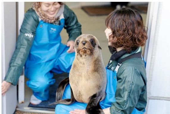
お客さまの前に初登場した時。飼育スタッフの足元に寄り添いながら新しい環境であそびました。