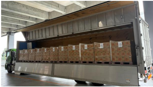
キッコーマン食品 N-DC(千葉県流山市)を出発するトラック