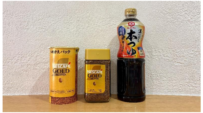
輸送する製品の例

左から: ネスレ日本「ネスカフェ ゴールドブレンド」、 キッコーマン食品「キッコーマン 濃いだし 本つゆ」