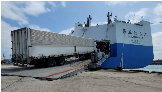
堺泉北港(大阪府堺市)で、トラックが船に乗り入れる様子

(※1) 荷物を届けた後の復路で別の荷物を運ぶことで空荷を減らし、効率を高める方法のこと