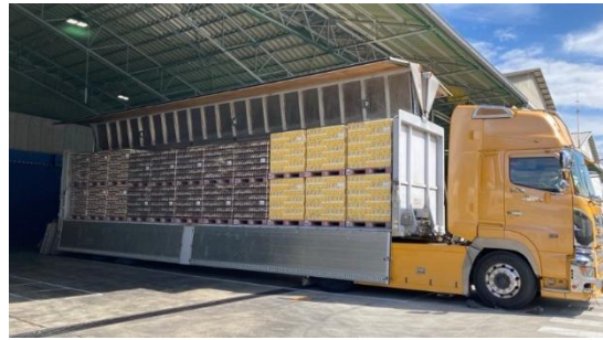
ネスレ日本 姫路工場(兵庫県姫路市)を出発するトラック