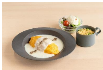
クリームソースオムライス