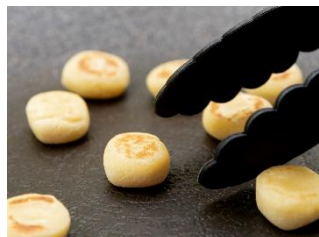
焼いて食べるニョッキ