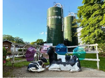
どうぶつふれあい広場