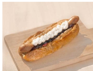
牧場リコッタチーズドッグ