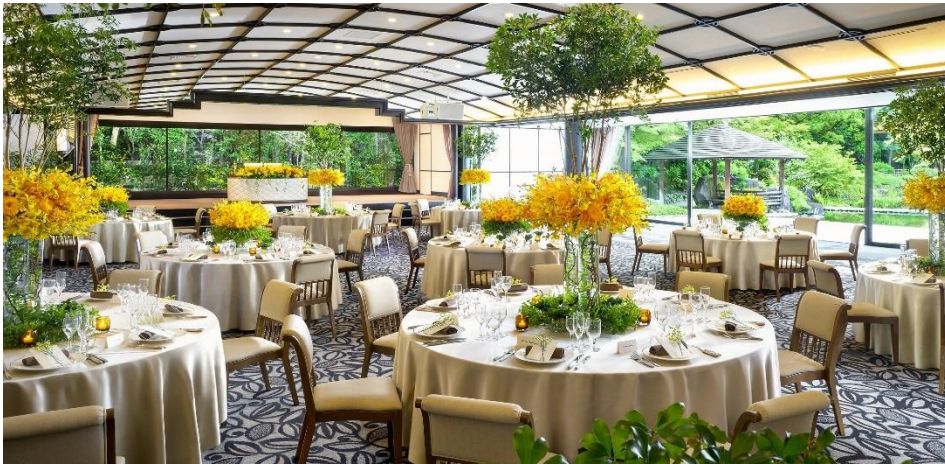
※2015年9月にリニューアルオープンした「ガーデンホール」

「豊生殿」がオープンする別館には、レセプション(受付)、待合室(※新設)、ブライズルーム(※新設)、パーティ会場「ガーデンホール」(※2015年9月リニューアルオープン)もあり、和のゲストハウスのスタイルでご利用頂けます。挙式から披露宴まで同館内で導線が完結でき、移動が大変スムーズな点もメリットです。美しい庭園に新しいオーセンティックな空間を融合させることで、唯一無二の空間をご提案致します。