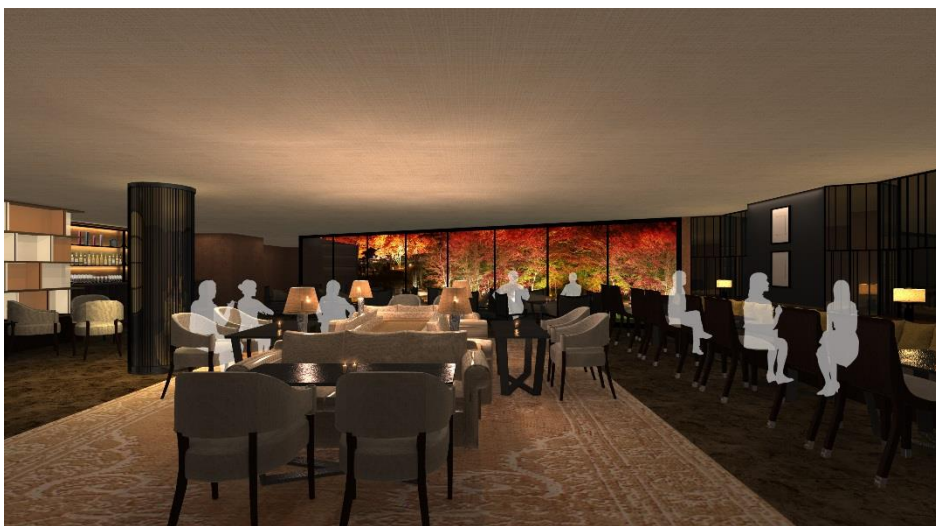
※別館 ラウンジスペース(イメージ)

これまでの伝統や格式を大切にしながらも、トレンドに敏感でオリジナリティを好み、和婚にこだわりたいカップルを新たなターゲットに、様々な婚礼スタイルに対応することで、より多くのカップルにご支持頂ける関西No.1結婚式場を目指して参ります。