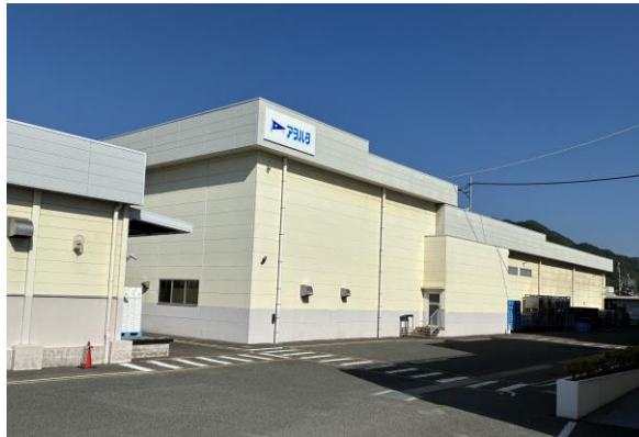
アヲハタ ジャム工場