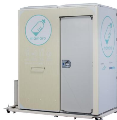
〔屋外型ベビーケアルーム（イメージ）〕