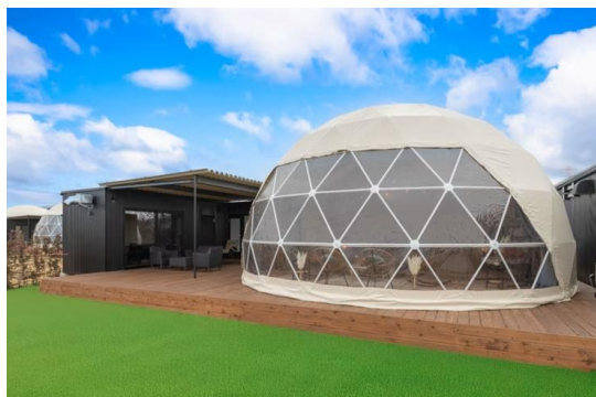
[プライベートガーデンドーム]