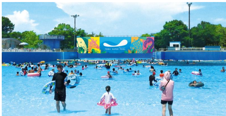
〔波のプール（イメージ）〕