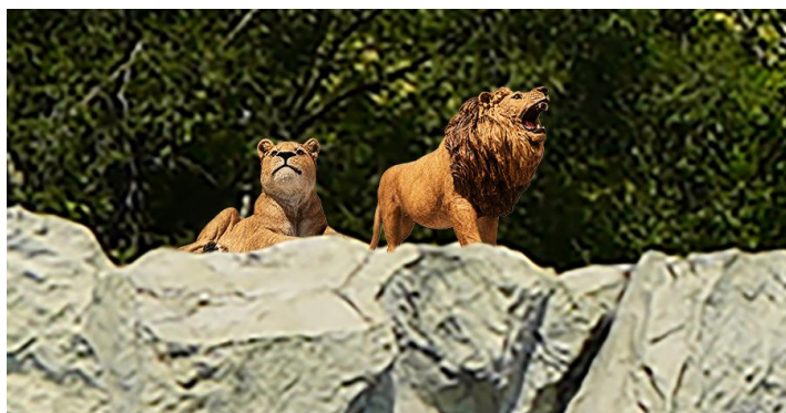
〔動物モチーフ（イメージ）〕

プールエリア一帯の装飾を「SAFARI COAST」をテーマに一新。まるで大自然のサファリに飛び込んだかのような動物たちのモチーフや装飾がエリアを彩ります。また、乳幼児をお連れのファミリーにも心から安心していただけるよう、プールエリア内に授乳やおむつ替えができる「屋外型ベビーケアルーム」を導入。さらに、「冷房完備の更衣室」を新設し、泳いだ後の着替えや、お子様のお世話も涼しく快適に行うことができます。