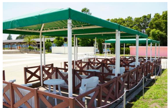
[有料ロイヤルシート席]