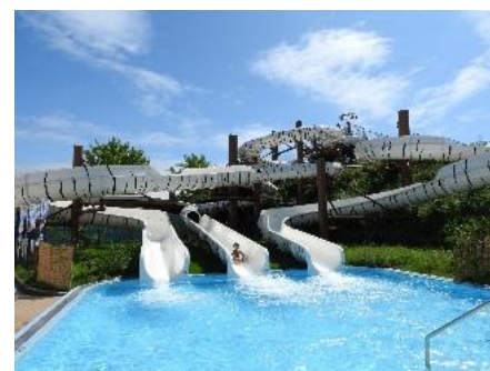
<タイガースプラッシュ>