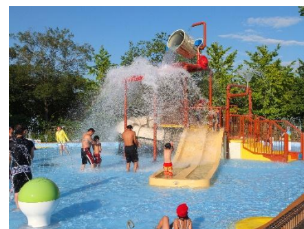
<じゃぶじゃぶアドベンチャー>