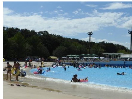
<波のプール (ウェイブプール) >