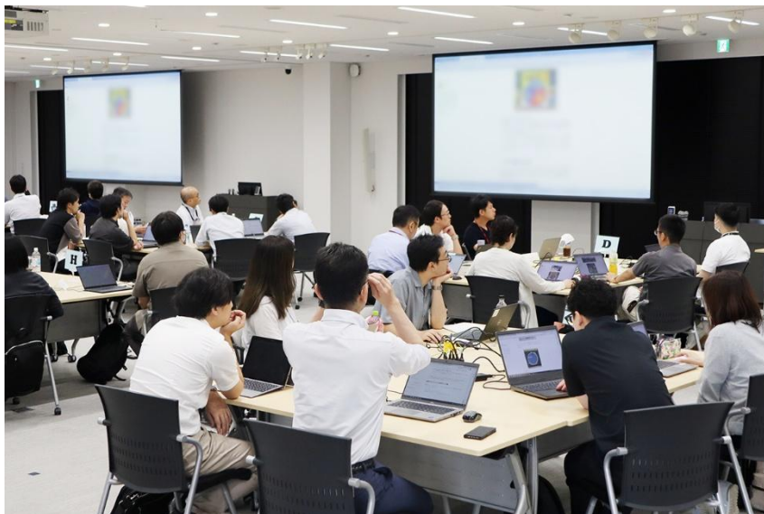
デジタル人財育成研修の様子

DXを牽引する組織として、社内DXコンサル機能とシステム開発体制を整備しています。また、デジタル人財育成プログラムを開発・運用しており、2024年末時点で1750人まで拡充したグローバルデジタル人財を、2026年末には2000人レベルにまで引き上げることを計画しています。