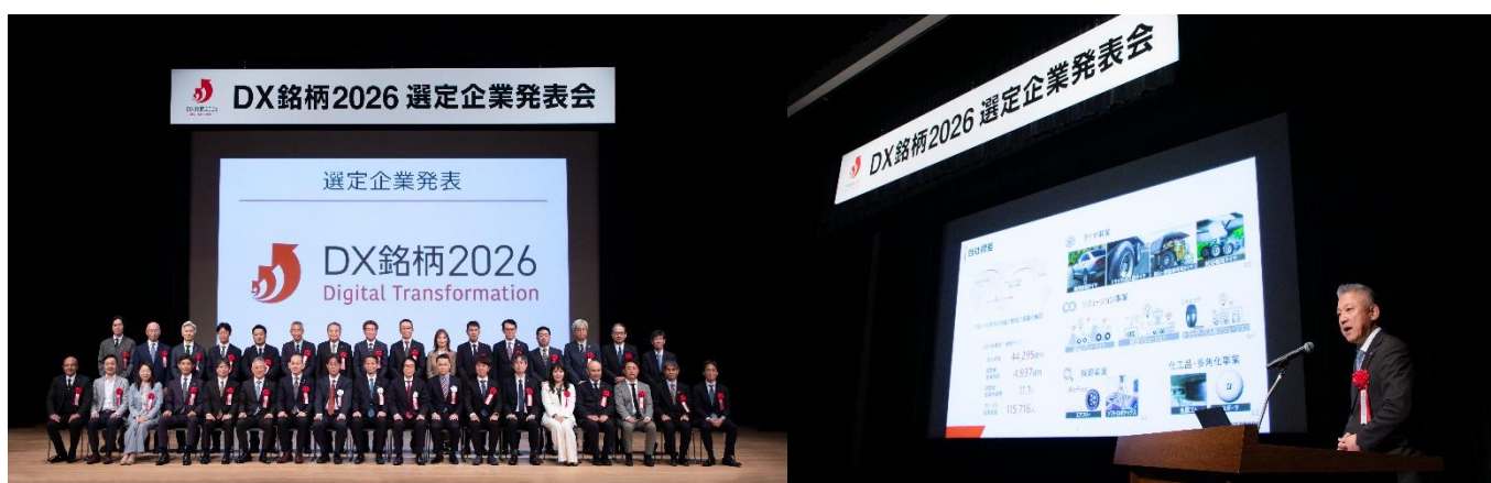
「DX銘柄2026」選定企業発表会

「DXグランプリ」は、DX銘柄に選定された企業の中から、“デジタル時代を先導する企業”として、特に優れたDXの取り組みを行った企業を選定するものです。