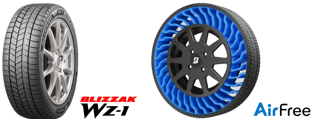
リアルとデジタルを駆使して企画・開発したタイヤ「BLIZZAK WZ-1」（左）と 空気充填の要らない次世代タイヤ「AirFree」

当社の現場密着型のサービスで得た市場・顧客データや経験則に基づく実験・実証で培ってきた技術・開発データといったリアルに、AI やシミュレーションなどのデジタルを融合して構築した独自のシミュレーションやアルゴリズムを活用してイノベーションを加速させています。