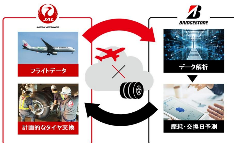
航空ソリューションのビジネスモデル

コア事業であるタイヤ事業において、エンジニアリングチェーンとサプライチェーン全体でDXを推進・融合させることで、魅力的な商品の開発とビジネスコストダウンを同時に実現しました。さらに新規ビジネスモデルとして、鉱山・航空ソリューションなど、生産財系 BtoB 事業においてタイヤを「創って売る」段階からお客様が「使う」段階で価値を増幅するソリューションへの転換を進めています。例えば、航空ソリューションでは、高い商品力を基盤に、複数回のリトレッド ※2 やタイヤ摩耗・耐久予測を組み合わせることで、タイヤ一本あたりの価値を最大化し、航空会社オペレーションの生産性・経済価値の最大化を図るとともに、資源生産性などサステナビリティにも貢献するソリューションを展開しています。