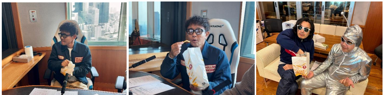
『ごぶごぶラジオ』での試食シーン(ごぶごぶラジオ公式Xより)