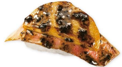
国産牛のロッシーニ風 黒トリュフソース(一貫) 380円 販売期間:販売中~6月21日(日) ※お持ち帰り不可