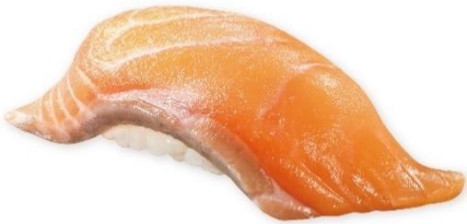
アトランティック 生サーモン(一貫) 160円 販売期間:6月12日(金)~6月21日(日)