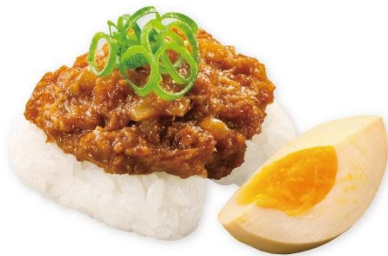
台湾ルーローハン 180円 販売期間:6月12日(金)~6月21日(日) ※お持ち帰り不可