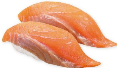
北海道 サーモン 270円 販売期間:6月12日(金)~6月21日(日)