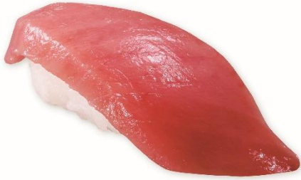
熟成中とろ(一貫) 110円 販売期間:6月12日(金)~6月14日(日) ※全店同一価格での販売