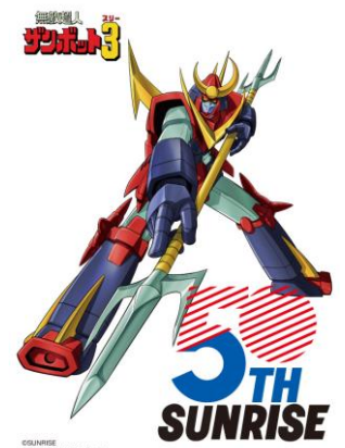
「無敵超人ザンボット3」全身ビジュアル サンライズ公式Xで順次公開