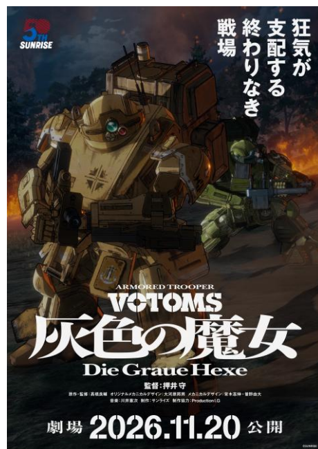
『装甲騎兵ボトムズ 灰色の魔女』 ティザービジュアル