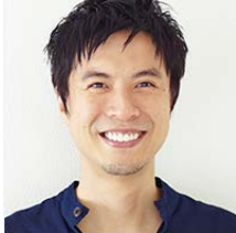
コウテンケツ (料理研究家)