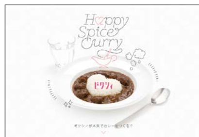
ゼクシィキッチン