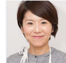
ワタナベマキ (料理研究家)