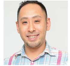
きじまりゆうた (料理研究家)