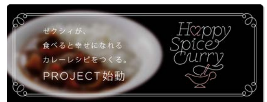
ゼクシィ しあわせカレープロジェクトサイト