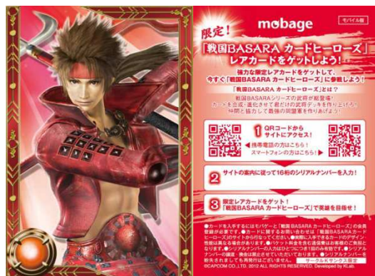
【赤いカード】モバイルゲーム版 「戦国BASARAカードヒーローズ」限定