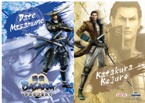
①伊達政宗、片倉小十郎

※景品がなくなり次第終了 クリアファイルが一枚もらえます。 購入で、 ロットボトルガム（対象7商品）