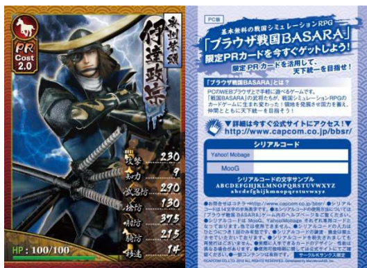
【青いカード】PCゲーム版 「ブラウザ戦国BASARA」限定

それぞれのカードに記載されたシリアル番号を使用して、お客様ご自身でPC、モバイル、それぞれのサイトにアクセスしてゲーム内で使用できる限定レアカードもGETできます！ ●PC版ゲーム：6/5(火)正式サービス開始 ●モバイル版：5/29(火)正式サービス開始