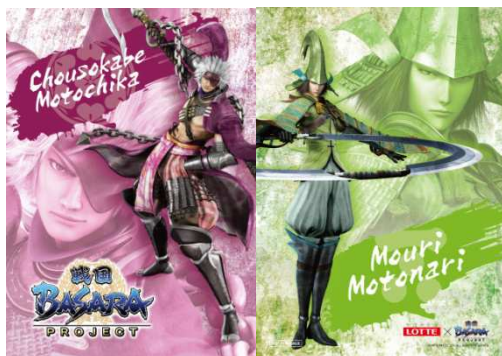
⑤長曾我部元親、毛利元就