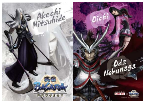
⑥明智光秀、織田信長・お市