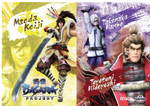
③前田慶次、豊臣秀吉・竹中半兵衛