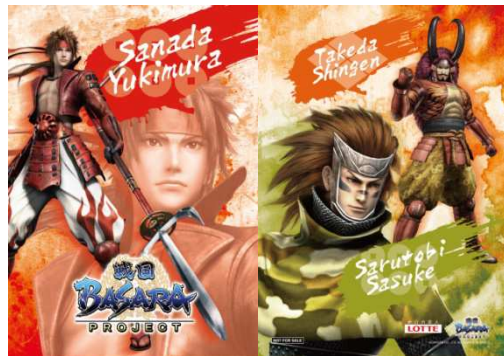
②真田幸村、猿飛佐助・武田信玄