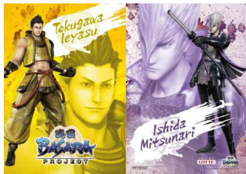
④徳川家康、石田三成