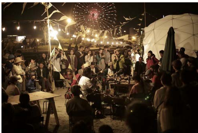
アイリッシュミュージックパーティー(イメージ)

「星空の楽団クリスマスアーティストライブ」ではアーティストによるペンギンの卵が生まれたことをお祝いするクリスマスライブパフォーマンスを開催します。また、アイリッシュミュージックパーティー(※)ではギターやアコーディオン、ハーモニカなどさまざまな楽器が奏でるアイルランドの音楽をお楽しみいただけるほか、クリスマスの雰囲気でも盛り上がる館内をパレードし、いきものたちと音楽がコラボレーションします。