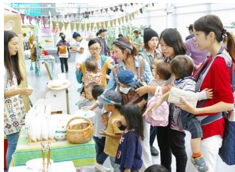
さまざまなグッズがそろうマーケット(イメージ)