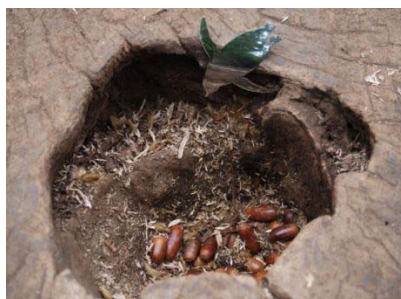
ペンギンが遊ぶ姿を見つけて楽しもう