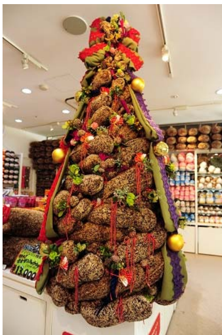
「オオサンショウウオぬいぐるみツリー」（画像は昨年）

オオサンショウウオぬいぐるみを 100 個以上装飾した「オオサンショウウオぬいぐるみツリー」をミュージアムショップに展示します。今年のテーマは着物の生地をガーランド（素材をつなげて網状にしたもの）に見立てた「THE KYOTO MIX」。クリスマスツリー専用の緑色のオオサンショウウオぬいぐるみ（非売品）も使用しインパクトのあるクリスマスツリーに仕上げました。