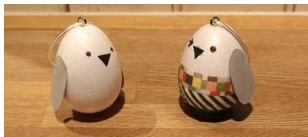
1羽1羽表情も違うオリジナルのペンギンオーナメント

ペンギンの赤ちゃんの誕生と成長を願って「かいじゅうゾーン」に設置したクリスマスツリーに飾ることができます。