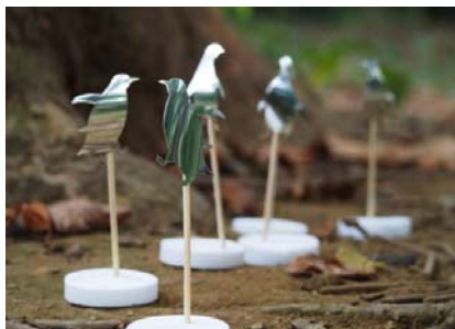
鏡面素材で作られた 101 羽のペンギン