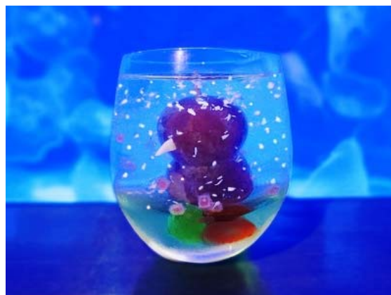
クリスマスらしい見た目が楽しい「ペンギンスノードーム」