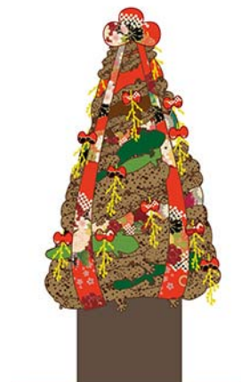
今年のテーマは「THE KYOTO MIX」

オオサンショウウオぬいぐるみを 100 個以上装飾した「オオサンショウウオぬいぐるみツリー」をミュージアムショップに展示します。今年のテーマは着物の生地をガーランド（素材をつなげて網状にしたもの）に見立てた「THE KYOTO MIX」。クリスマスツリー専用の緑色のオオサンショウウオぬいぐるみ（非売品）も使用しインパクトのあるクリスマスツリーに仕上げました。