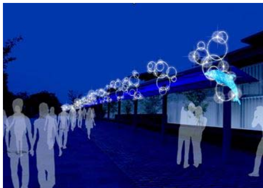
冬空に美しく輝く光のバブルリングイルミネーション