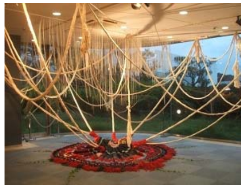
クリスティーナクリナ作品イメージ