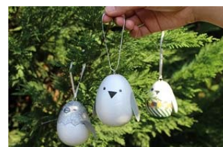
赤ちゃん誕生を願ってクリスマスツリーに飾ろう

開催期間:2015年11月13日(金)～12月25日(金) 開催時間:11時00分～15時00分(各日先着100名、なくなり次第終了) 開催場所:「ペンギンゾーン」1階特設スペース 料 金:無料(京都水族館の入場料を含む)