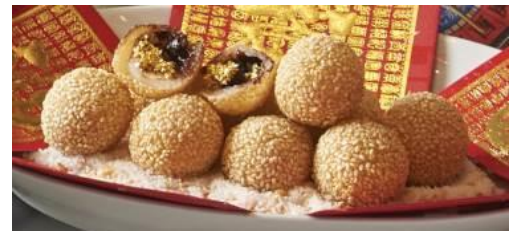
開運チョコバナナゴマ団子

・開運チョコバナナゴマ団子 人数×300 円 ★新メニュー ご注文いただいたチョコバナナゴマ団子のうち、一つだけ金粉入りのものをご用意します。新年の運試しに盛り上がるデザートです。