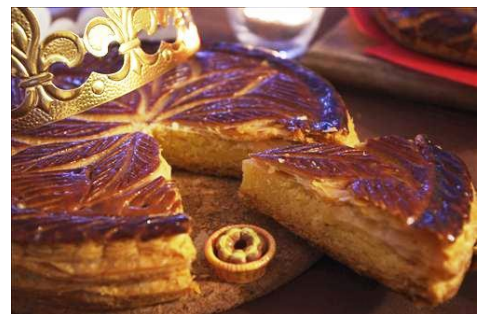
ガレット デ ロワ