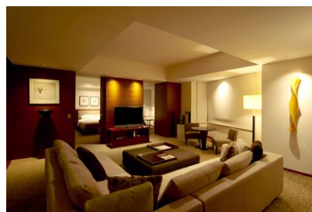
グランド エグゼクティブ スイート