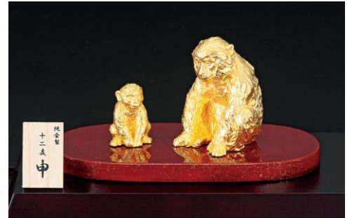
↑K24 優愛「申」石田信裕 原作 637,200円（計約28g）