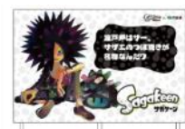
「ダウニー&スーパーサザエの看板」