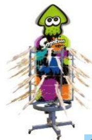
「spratトゥーン公式 呼子名物いかぐるぐる」イメージ