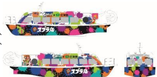
「スプラ丸」イメージ

問合せ先 マリナル呼子 (TEL 0120-425-194/年中無休) ※当日の運航状況は直接お訊ねください