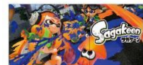
「呼子のイカす広場」イメージ