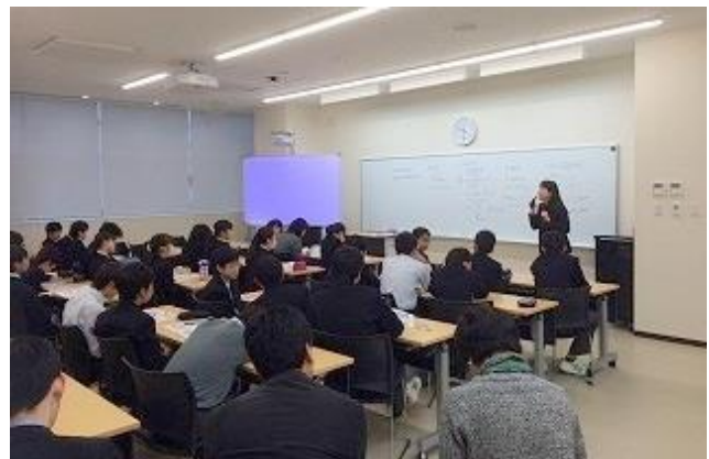
11月25日・多摩大学目黒中学校でのワークショップ