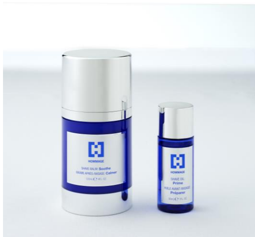
左から：シェーブ バーム、シェーブ オイル