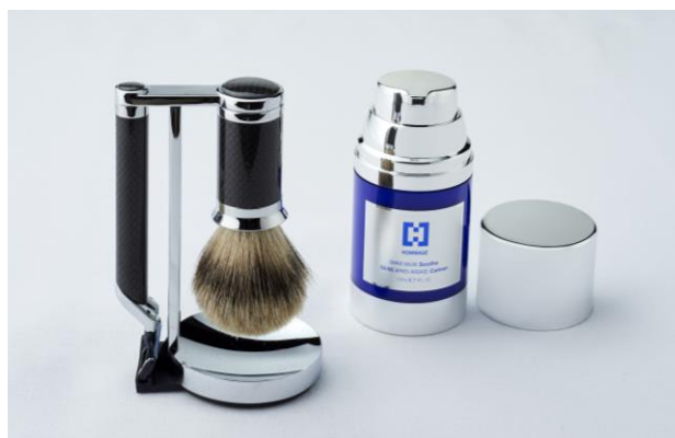
上: HOMMAGE 化粧品 下: レーザーセットとシェーブバーム