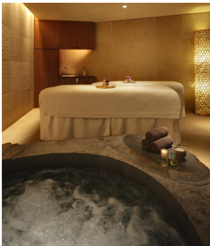
Nagomi スパ アンド フィットネス

厳選された天然の素材を使用した究極のリラクゼーション空間で、洗練された大人の男性にふさわしいグルーミング体験をぜひご堪能ください。