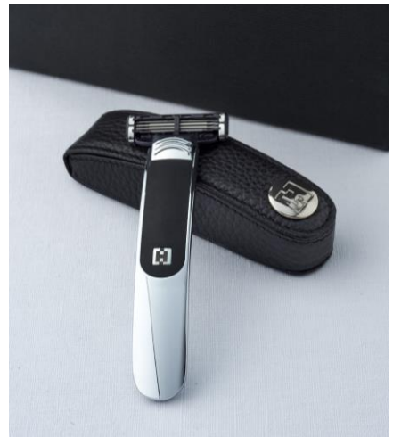
VERONA シングルレーザー