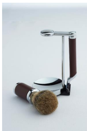
SANTIAGO シェービングセット