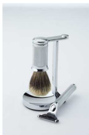
STOCKHOLM シェービングセット