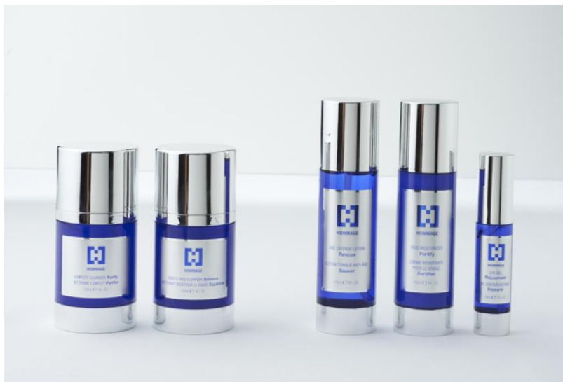
左から：コンプリート クレンザー、ジェントル フェイス クレンザー、エイジ ディフェンス ローション、フェイス モイスチャライザー、アイ ジェル

・Shave Balm (シェーブ バーム) 12,000 円 この全肌タイプに適したバーム。ひげそり後のお肌に心地よく浸透します。