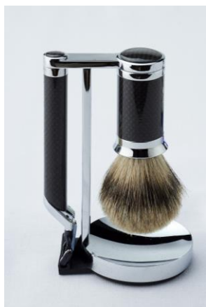
CARBON FIBER シェービングセット