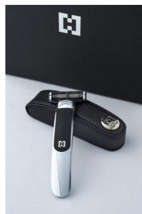
VERONA シングルレーザー