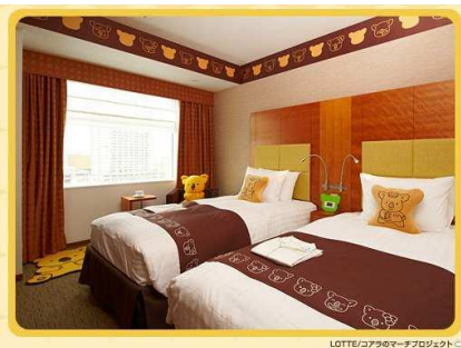
コアラのマーチルーム① マーチくん部屋(全2室)

ロッテ大人気のお菓子「コアラのマーチ」のキャラクターとコラボレーションしたファミリーに大人気のお部屋です。