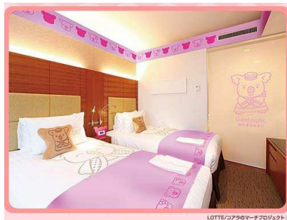
コアラのマーチルーム② ワルツちゃん部屋(全2室)